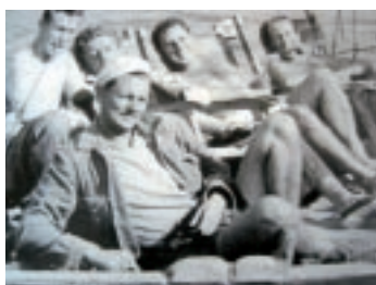
I "ragazzi della Panaria"